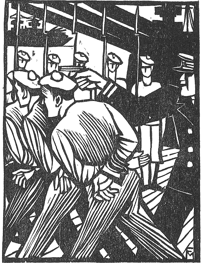
DIE MATROSEN VON CATTARO