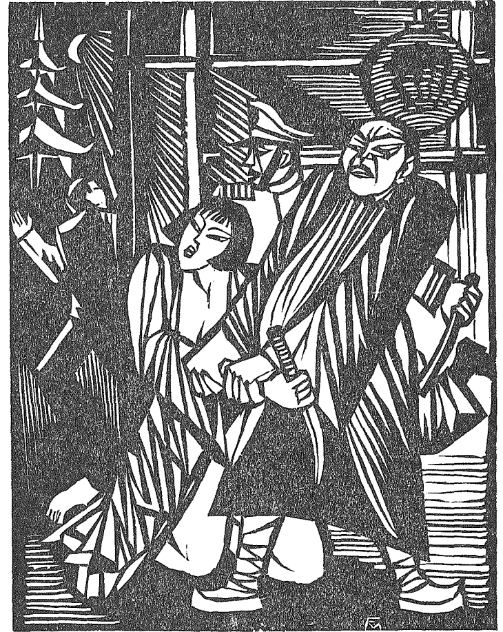
TAI YANG ERWACHT