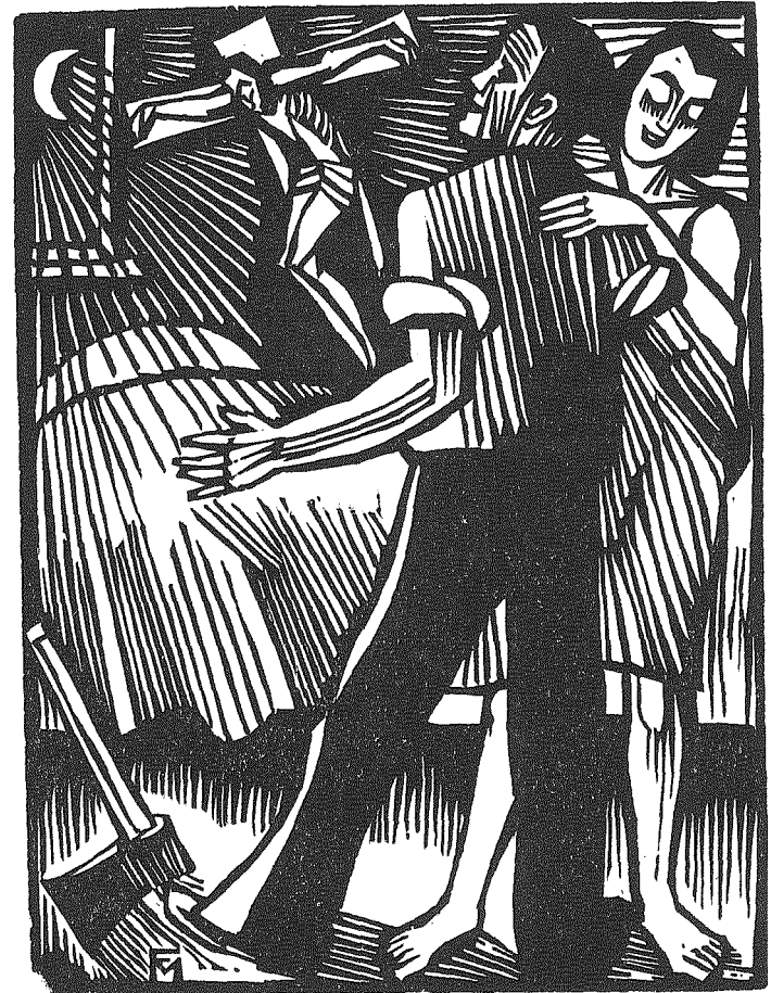
DAS BIST DU

Dies Ineinander der Beziehungen von Larven- und Erinnerungswesen gehört zu Wolfs fesselndsten Eingebungen. Von der ersten Verwandlung ab jedoch sind die Ziffern mittels individueller Personen konkret geworden: in einem Gärtner und seinem Weibe, seinem Gesellen und dem Schmied; aber auch in den Dingen: der Bank, dem Kreuz, der Axt. Und nun hebt eine ganz erdenhafte Handlung an von der Frau zwischen zwei Männern, von Eheverschulden und Mord am Verführer. Das langsame Zusammenbrauen