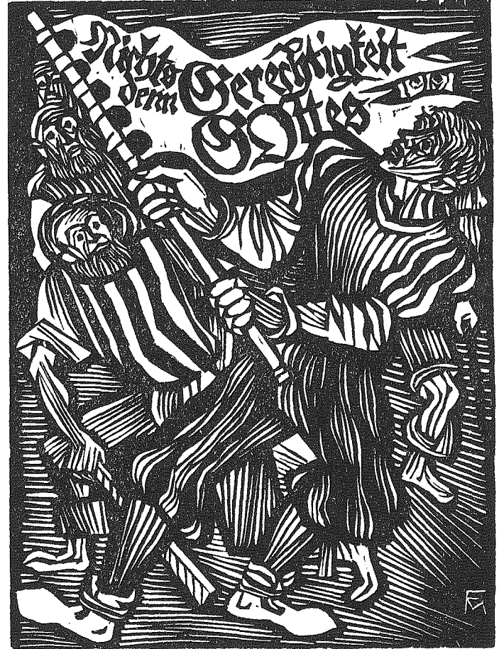
DER ARME KONRAD

Und die Schwarzweißkunst in den Holzschnitten und Radierungen eines Hans Holbein („Totentanz“), eines Rembrandt, Dürer, Goya und Daumier sind bei der Zeitenwende die Kunstform, um am klarsten, streitbarsten und künstlerischsten einen Gedankeninhalt auszudrücken.